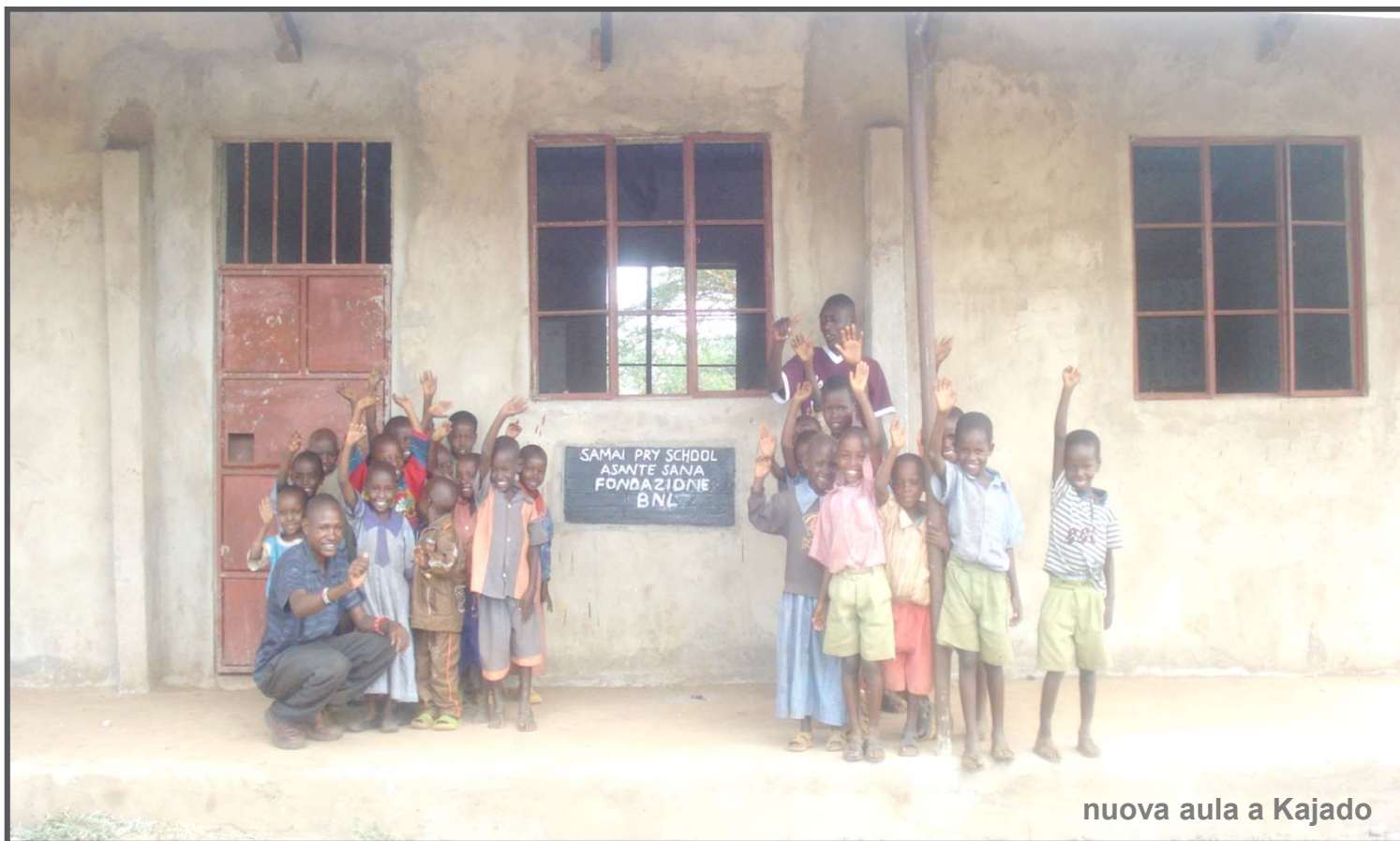
nuova aula a Kajado