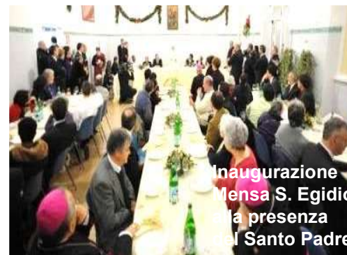
Inaugurazione Mensa S. Egidio con la presenza del Santo Padre

La Fondazione BNL è inoltre da sempre presente nel sostegno del Centro Astalli , realtà che ogni anno risponde ai bisogni di oltre 40.000 migranti e nel solo 2018 ha permesso la distribuzione di oltre 60.000 pasti a rifugiati e richiedenti asilo.