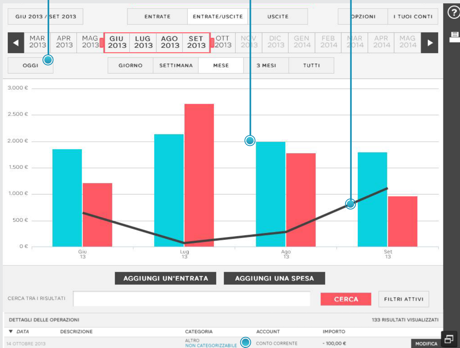
TABELLA CON ELENCO DI TUTTI I MOVIMENTI