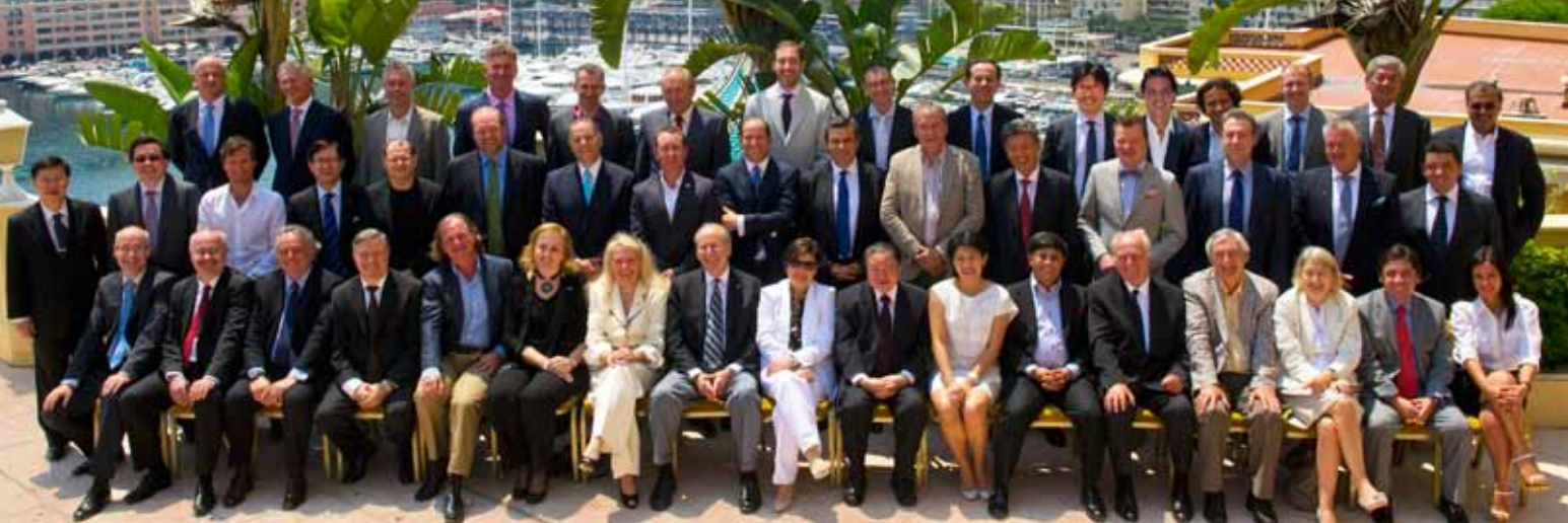
Foto di gruppo dei vincitori nazionali 2010 a Montecarlo, durante il World Entrepreneur Of The Year 2011.