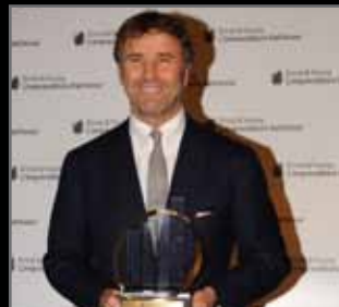
Brunello Cucinelli Brunello Cucinelli S.p.A. Vincitore Nazionale 2009