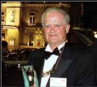
Paolo Della Porta Saes Getters S.p.A. Vincitore Mondiale 2001 Vincitore Nazionale 2000

“Questo riconoscimento mi riempie di gioia e soddisfazione. Dopo la vittoria nazionale, aver raggiunto questo traguardo significa un riconoscimento ulteriore all'azienda”.