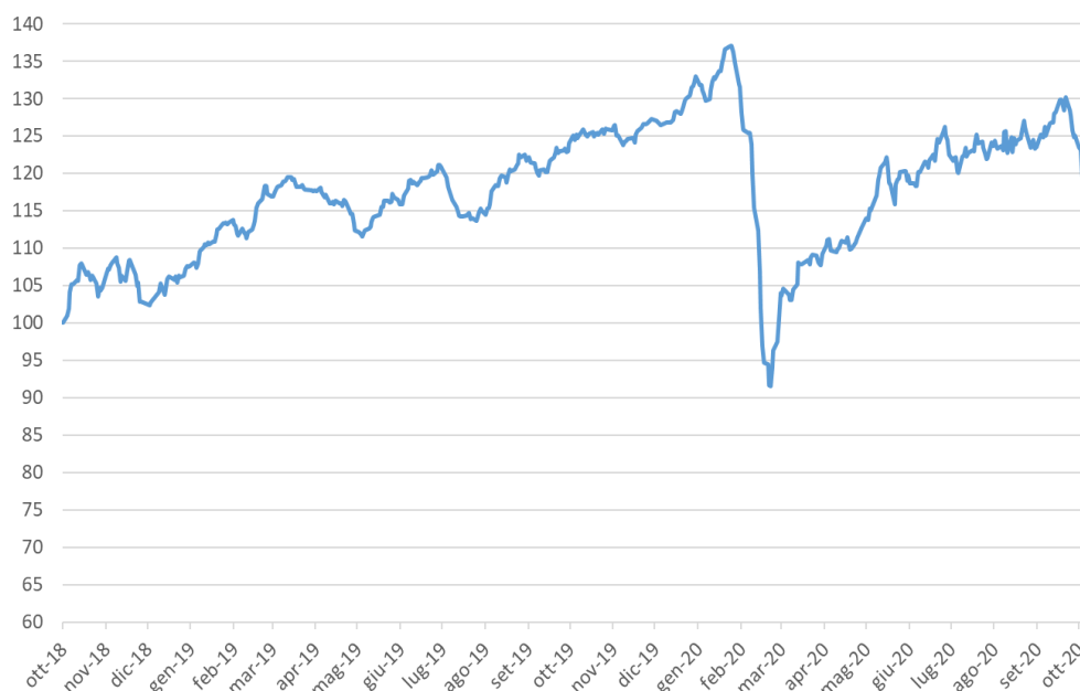
Performance Paniere Equipeso negli ultimi 2 anni (dal 26/10/2018 al 28/10/2020)